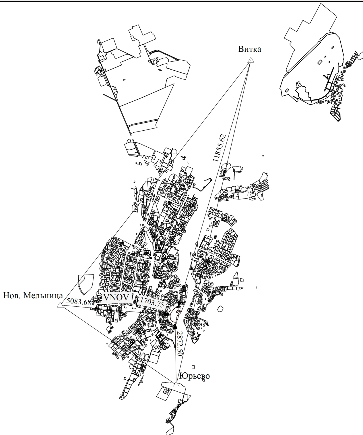
Схема геодезических построений